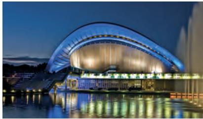
Haus der Kulturen der Welt